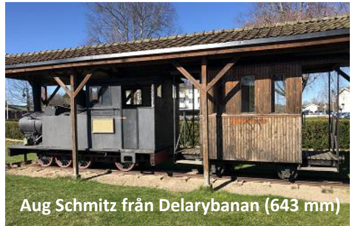
Aug Schmitz från Delarybanan (643 mm)

Skåne-Smålands Järnväg (normalspår, 1435 mm)