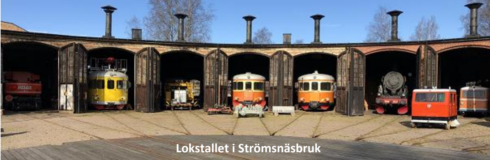
Lokstallet i Strömsnäsbruk